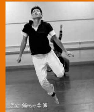
Charm Offensive

MARDI 22 MAI • 15 H 00 DANSE / RÉPÉTITION PUBLIQUE • ENTRÉE LIBRE