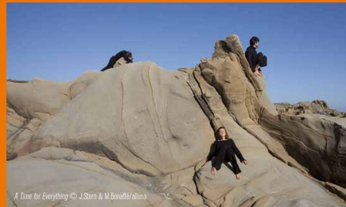
A Time for Everything © J.Stern & M.Bonaffé/alluna

Événement CDC Paris Réseau en partenariat avec le festival Entrez dans la danse et la Maison des Pratiques Artistiques Amateurs pendant la Fête de la Danse.