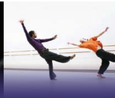
Pour la beauté du geste