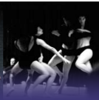
Ève sans feuille...