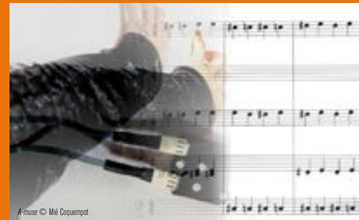
A-muse © Mié Coquempot

PLUS DE DÉTAILS SUR LES PROGRAMMES ET LES ARTISTES SUR http://www.leregarducygne/danse.html