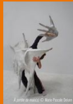
À portée de main(s) © Marie-Pascal Deluen