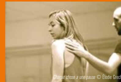
Chaque chose a une pause

PLUS DE DÉTAILS SUR LES PROGRAMMES ET LES ARTISTES SUR http://www.leregarducygne/danse.html